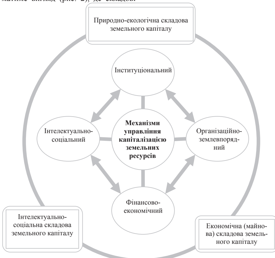
Рис. 2. Модель механізмів управління капіталізацією земельних ресурсів

земельного капіталу реалізуються через відповідні механізми у єдиному природно-екологічному, інтелектуально-соціальному та економічному просторовому середовищі.